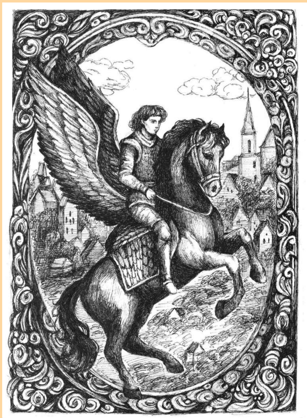
Иллюстрация к циклу «Царь Фантом»