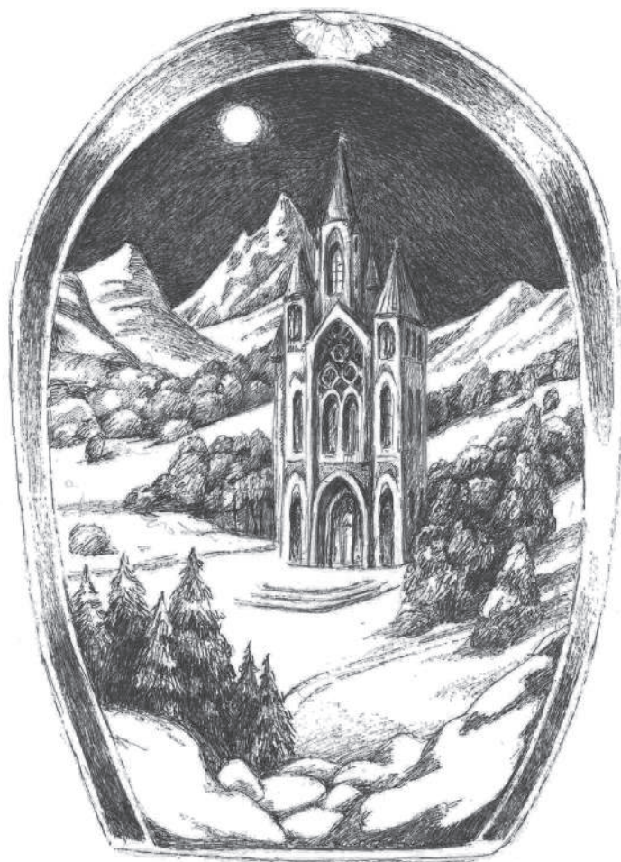
Ксения Чепеленко. Иллюстрация к циклу «Учитель»