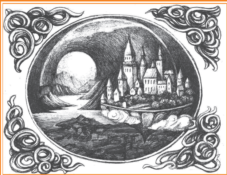
Ксения Чепеленко. Иллюстрация к циклу «Царь Фантом»