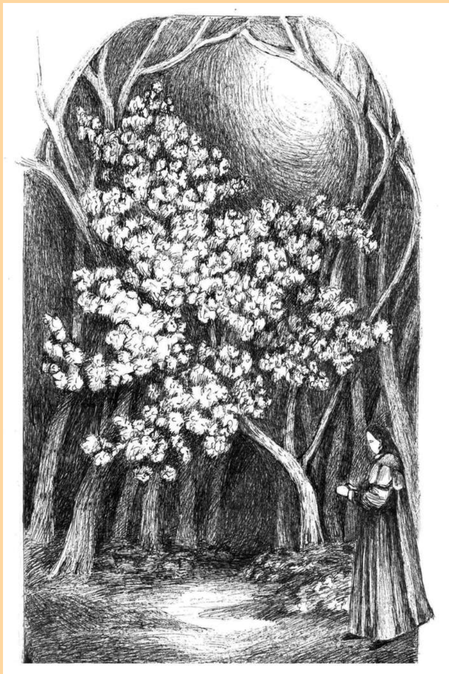
Иллюстрация к циклу «Учитель»