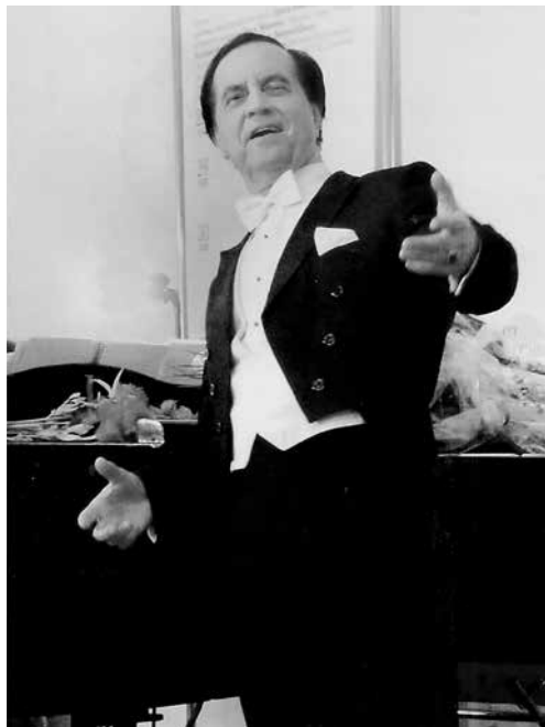
«Выйду на улицу...»