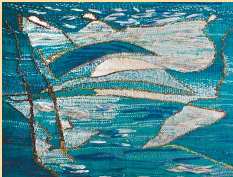
«И было утро». Гобелен