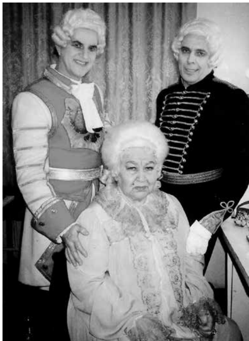
Народные артисты СССР Леонид Сметанников, Ирина Архипова, Владислав Пьявко. 2000 г.

Где дуб печалится могучий, Где степь ковыльная шумит, Седой утёс над дикой кручей Легенды древние хранит.