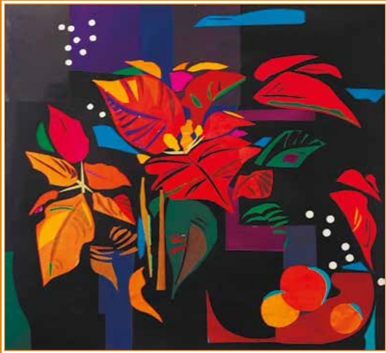
Наталья Никифорова «Рождественская звезда» (пуансеттия). Аппликация