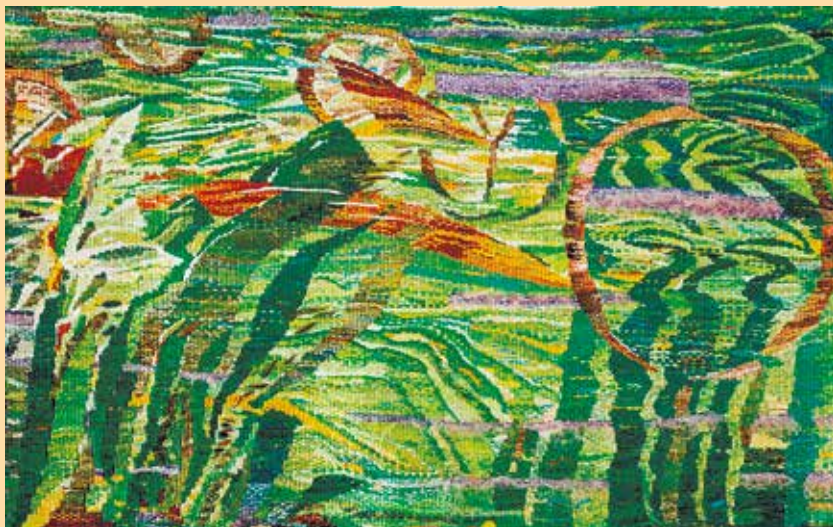
«Ветер. Травы». Гобелен