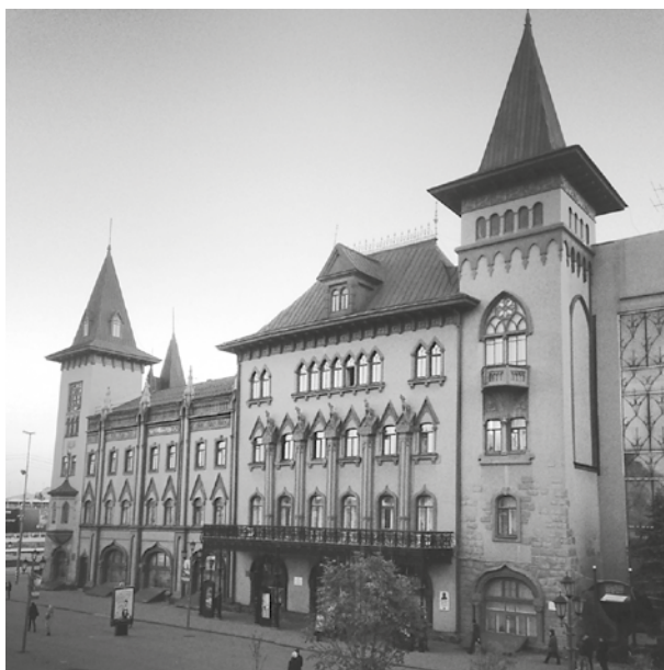
Саратовская государственная консерватория имени А.В. Собинова

Журнал «Волга–XXI век» зарегистрирован МПТР РФ, свидетельство ПИ № 77-16080 от 6 августа 2003 года.