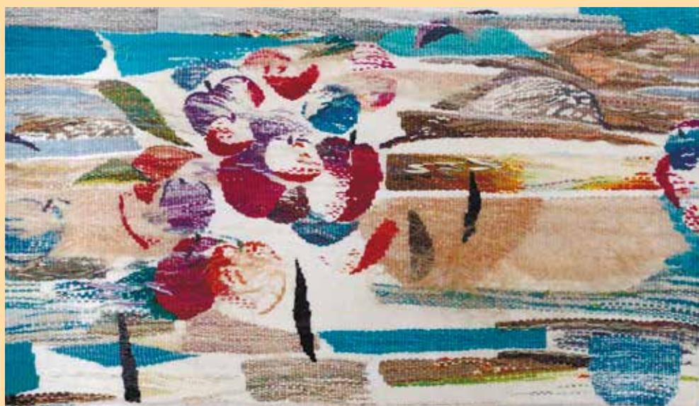
«Волжское марево». Гобелен