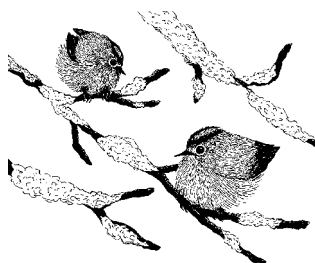
Корольки. Рисунок Полины Кожухиной