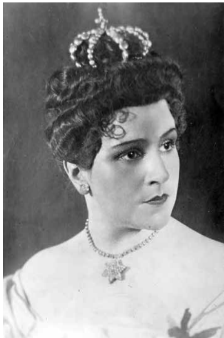
В роли королевы Елизаветы