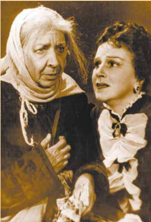
«Без вины виноватые». Кручинина. Галчиха – А. Стрижова