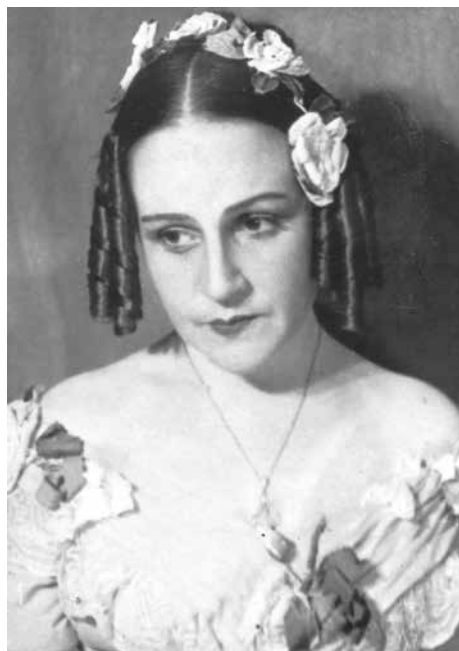
В роли Нины в «Маскараде»