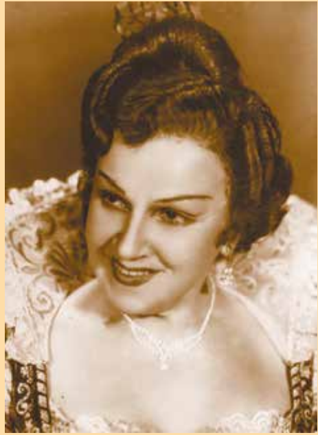
«Испанский священник». Виолетта. 1960 г.