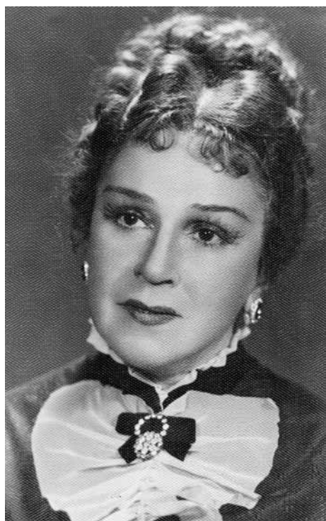
«Без вины виноватые». Кручинина