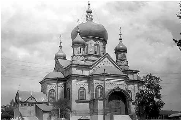
Петровск. Храм в честь Казанской иконы Божией Матери

Журнал «Волга–XXI век» зарегистрирован МПТР РФ, свидетельство ПИ № 77-16080 от 6 августа 2003 года.