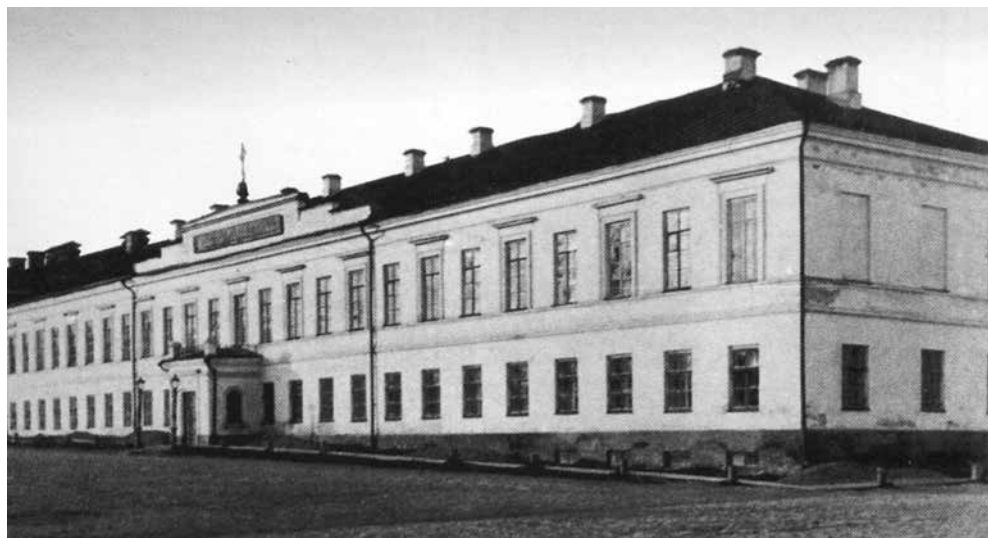
Симбирская классическая гимназия