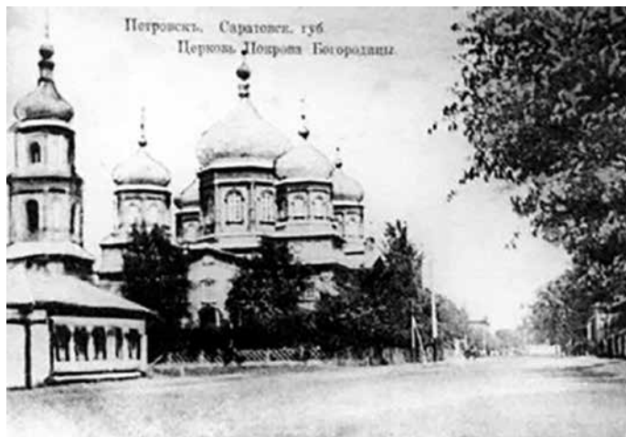
Собор Покрова Пресвятой Богородицы