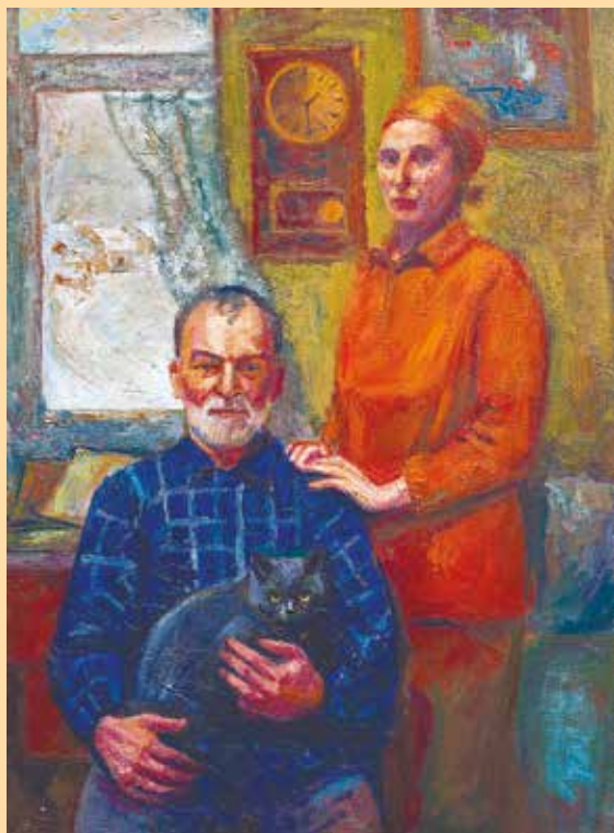
«Деревня за окном». 2010 год