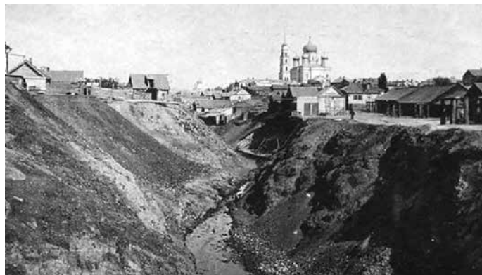
Рвы вокруг города Петровска

в настоящее время действуют 2 храма – Покрова Пресвятой Богородицы, построенный в 1884 году, и во имя Казанской иконы Божией Матери, открытый в 1871 году.