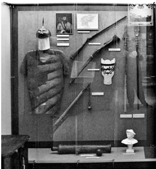
Экспонаты эпохи Петра I