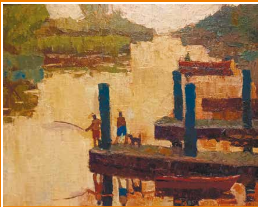
«Волжские дали». 2005 год