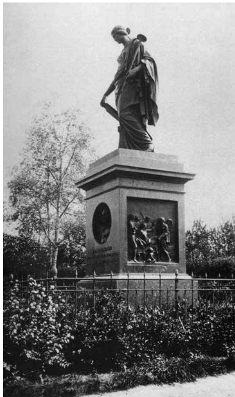
Памятник Н.М. Карамзину в Симбирске