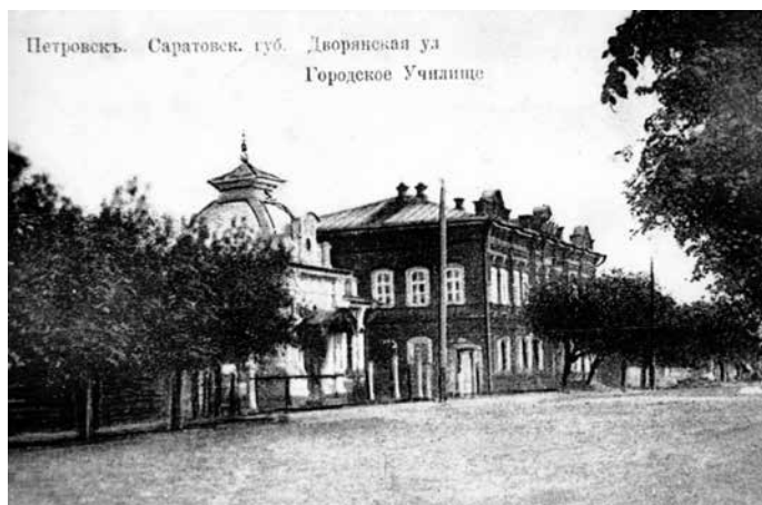
Дом купца Тихонова