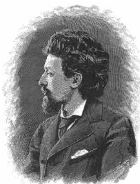
Дмитрий Николаевич Садовников

Так называли современники поэта и этнографа Дмитрия Николаевича Садовникова. Героями его произведений были мужественные и сильные люди, а местом действия – любимая река русского народа.