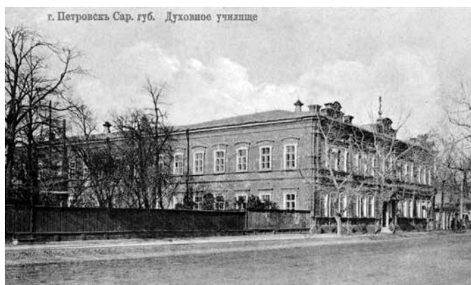
Духовное училище. Эвакогоспиталь 16-92

И об этом времени напоминают многие купеческие дома, которые представляют историческую ценность для нас и являются памятниками архитектуры.