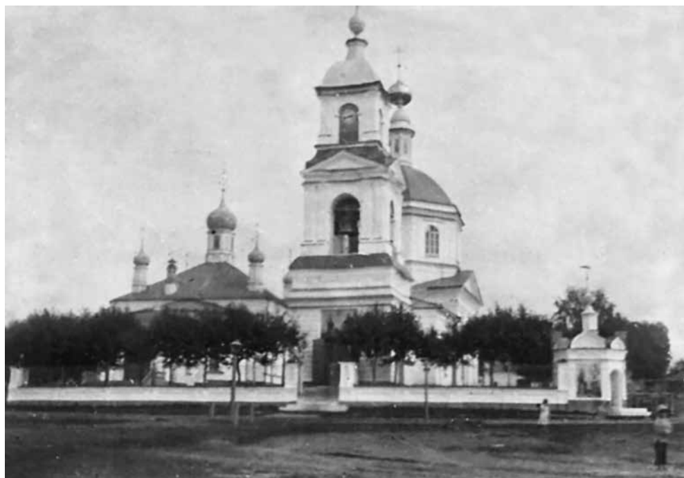
Собор Петра и Павла

ды. Вокруг стен шёл глубокий ров. Общая площадь составляла более 7 га. Внутри укрепления разместился первый построенный в нашем городе собор Петра и Павла.