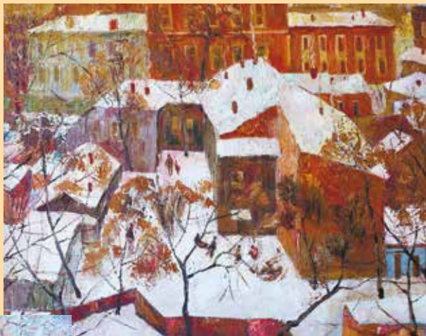
«Снег выпал». 2017 год