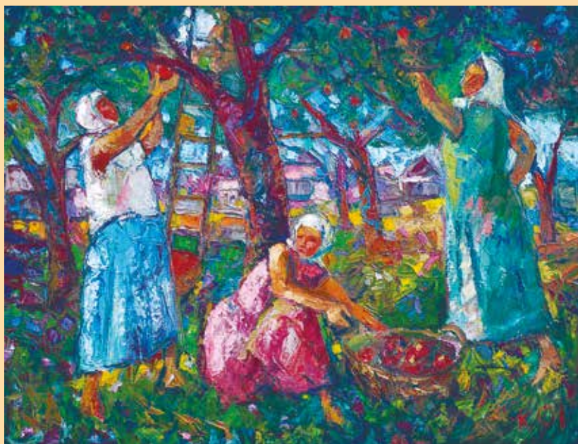
«Сбор яблок». 2015 год