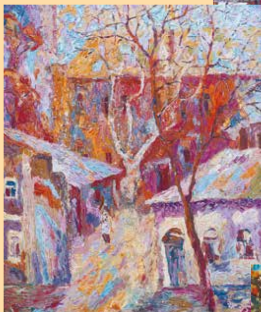
«Полдень». 1995 год