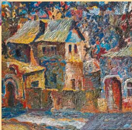
«Голубой город». 1996 год