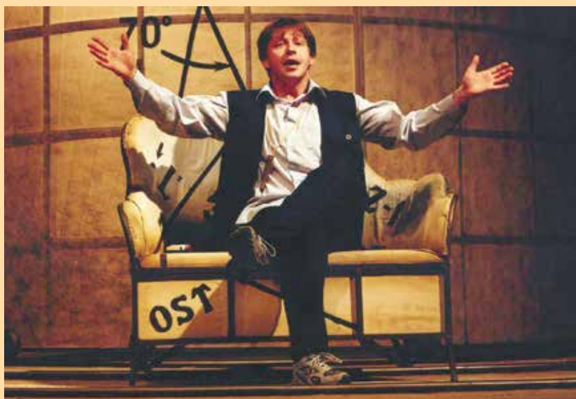
Антон Кузнецов в роли Фигаро