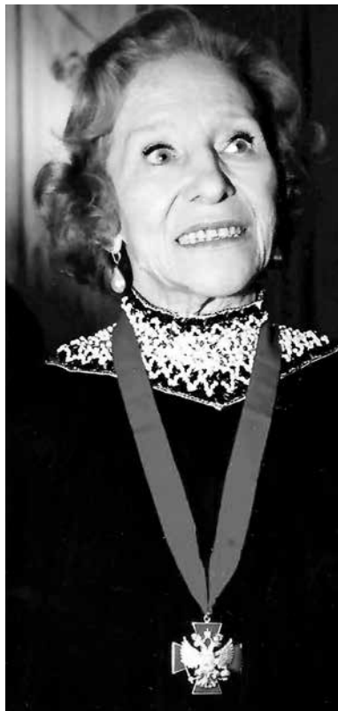
Ольга Васильевна Лепешинская