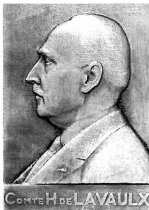
Медаль де Лаво

чением ордена Ленина. Как драгоценную реликвию держал я в руках медаль Анри де Лаво – высшую награду Международной авиационной федерации.