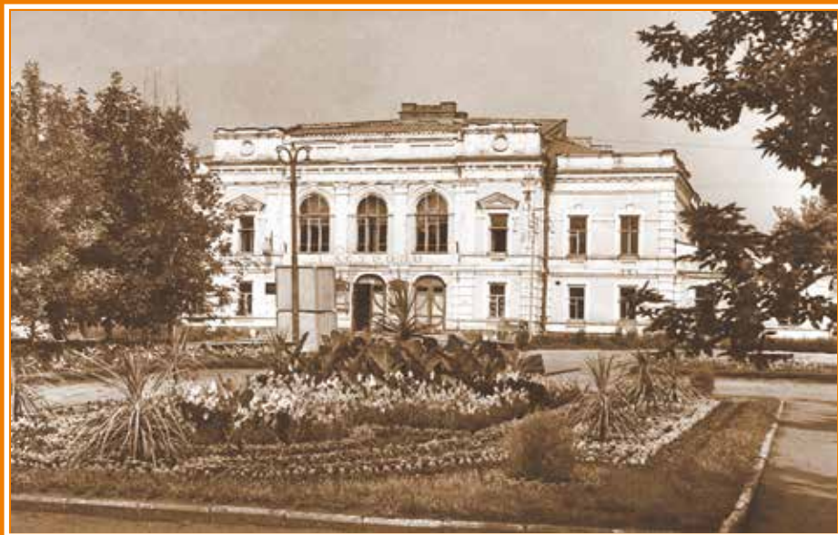
Театр драмы. Саратов (старое здание, 1960-е гг.)