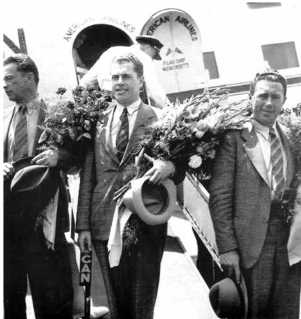
Прибытие в Вашингтон