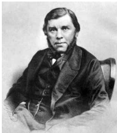
Владимир Александрович Соллогуб

щий был родом из Малороссии, около тридцати лет служил в гусарах и вышел в отставку в чине майора и с небольшой пенсией, 340 рублей в год.