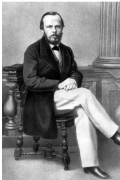
Фёдор Михайлович Достоевский. 1861

любезный Григорович, что я решаюсь послать к вам подателя этой записки, с тем, чтобы узнать, возвратились ли вы из Москвы. Мне очень хотелось бы видеться с вами, и если вы не в Дулебине, то в среду я бы приехал к вам. Я не взял с собою ни одной книги. Пока надеюсь на ваши. Можете себе представить, как я скучал всё это время. Пожалуйста, любезный Григорович, пришлите мне теперь что-нибудь почитать...» 8 .