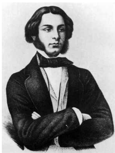
Дмитрий Васильевич Григорьевич. Литография 1854 г.