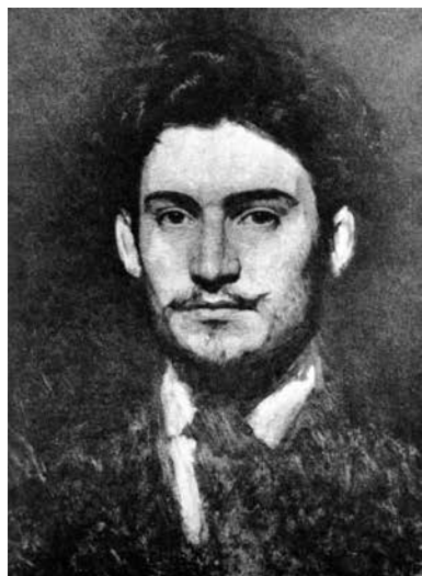
Фёдор Александрович Васильев

Материальное положение семьи Васильева было таково, что будущий живописец вынужден был самостоятельно зарабатывать с двенадцати лет. В 1865 году поступил в вечернюю рисовальную школу при Обществе поощрения художников, которую окончил через два года. Советы и опека опытного И. Н. Крамского, совместная работа на острове Валаам с великим И. И. Шишкиным уже в 1868 году делают Васильева известным, как автора полотен «Деревенская улица», «Возвращение стада», «После грозы», «Вид в Парголове». Последняя из упомянутых картин ныне находится в Саратовском государственном художественном музее им. А. Н. Радищева.