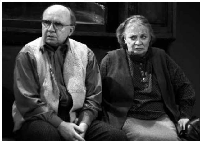
Андрей Мягков и Алла Покровская