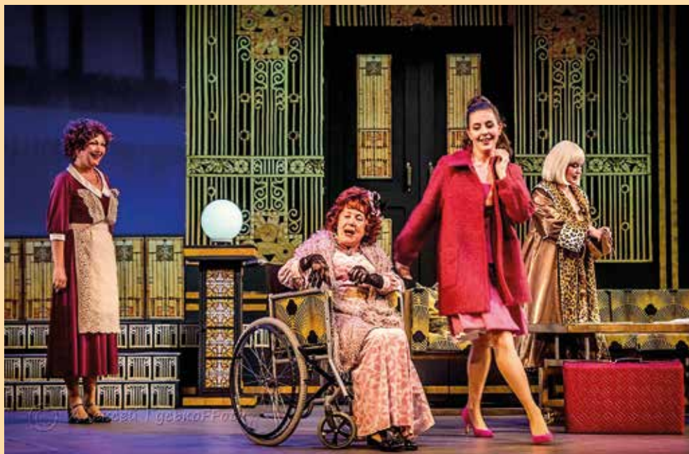
«Восемь любящих женщин» (Художник Юрий Наместников)