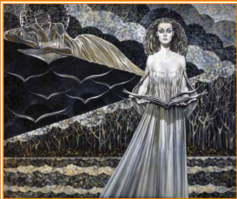
«Страницы» Художник Юрий Наместников