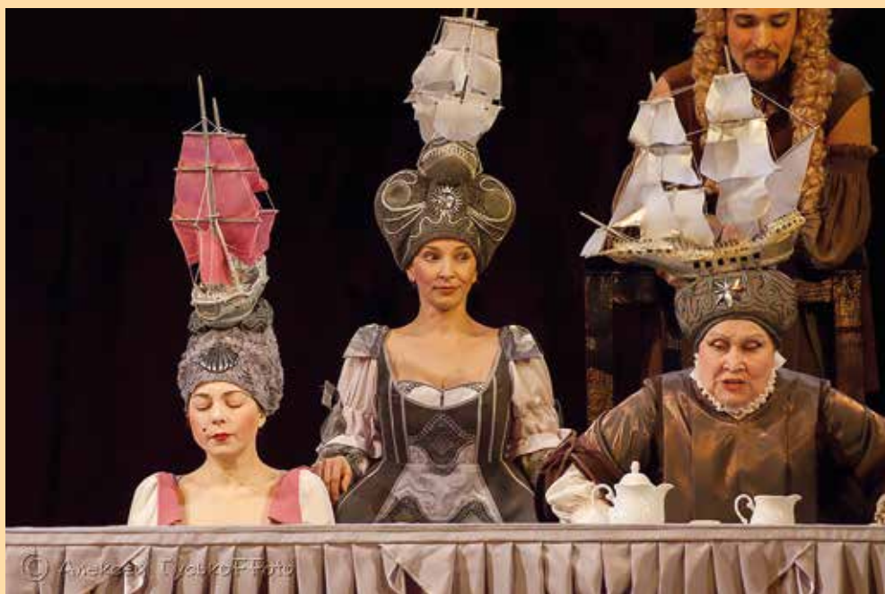
«Кабала святош» (Художник Юрий Наместников)

«Я – ЗА ТЕАТР ИНТЕЛЛЕКТУАЛЬНЫЙ, ЧЕСТНЫЙ И ТАЛАНТЛИВЫЙ»