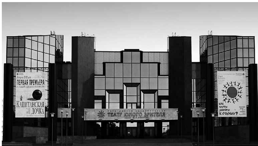
Саратовский академический театр юного зрителя им. Ю. П. Киселёва

Журнал «Волга–XXI век» зарегистрирован МПТР РФ, свидетельство ПИ № 77-16080 от 6 августа 2003 года.