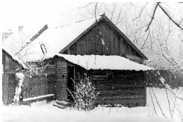
Старый домик на ул. Рахова – дом № 195, у школы № 21