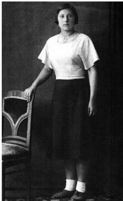
Вера. Саратов, 1937 год

ров. Бывала там и Вера. Она всегда имела успех у молодых курсантов, но не позволяла им за собой ухаживать, хотя парни были достойными.