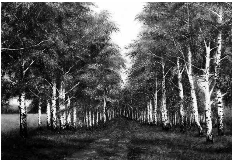
Наталья Шиндина. «Дорога на хутор», х. м., 2003 год

Журнал «Волга–XXI век» зарегистрирован МПТР РФ, свидетельство ПИ № 77-16080 от 6 августа 2003 года.