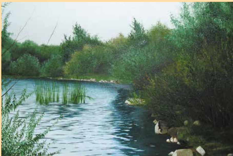
«Село Натальино. Утро»