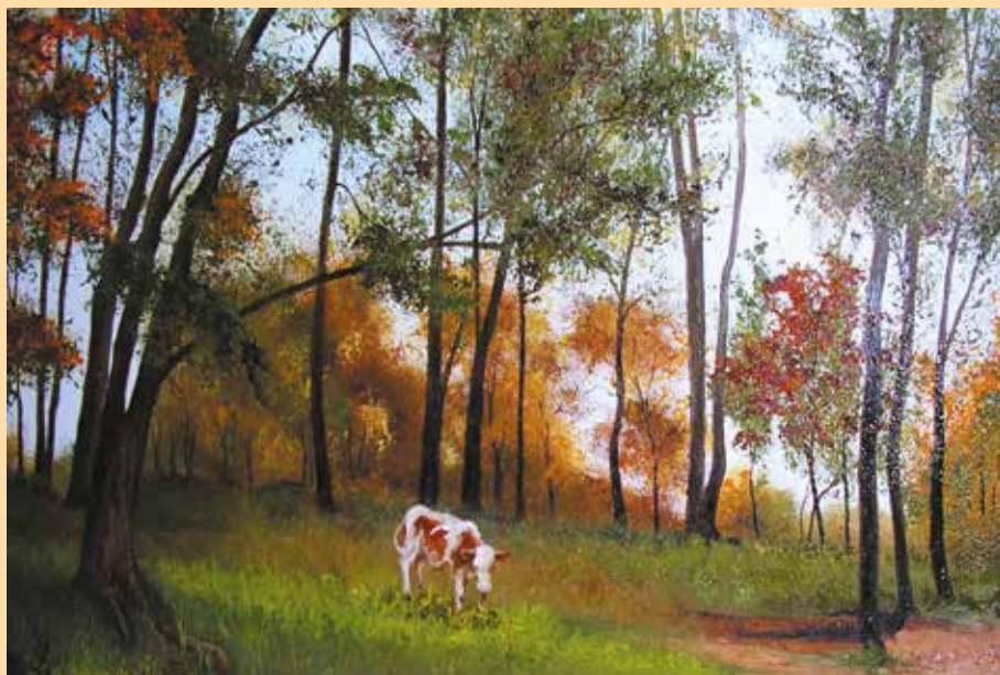
«Село Натальино. Осень и телёнок»