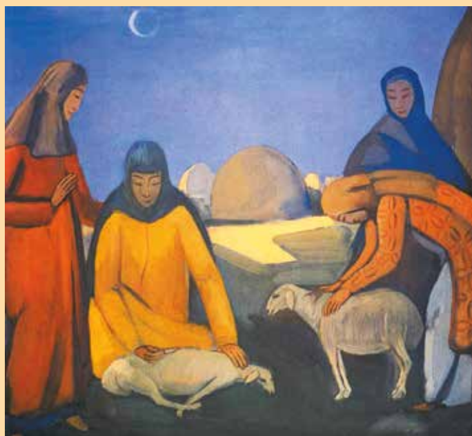
П.В. Кузнецов. «Стрижка овец»