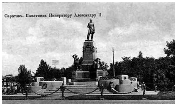
Саратов. Памятник Императору Александру II.

Грандиозный монумент был установлен перед главным входом в «Липки» (там, где теперь стоит памятник Чернышевскому) и разобран в 1918 году. Игно-