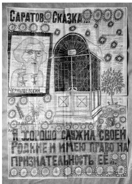
В. В. Капцов «Чернышевский. Из серии «Саратовские сказки»

В лубковом варианте, в «Саратовских сказках», В. В. Капцов показывает работу Чернышевского на руднике в истинно сказовом духе. Поза героя, полосатое тюремное одеяние, огромный камень в руках, капли пота на челе, разудалая охрана, развлекающаяся на всякий лад, колючая проволока, рудник, данный в разрезе, название сюжета, встроенное в композиционное пространство листа, – всё это свидетельство прямого участия современного человека в формировании