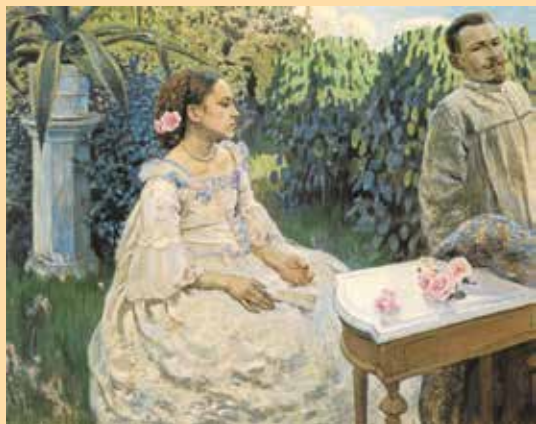
В.Э. Борисов-Мусатов. «Автопортрет с сестрой»