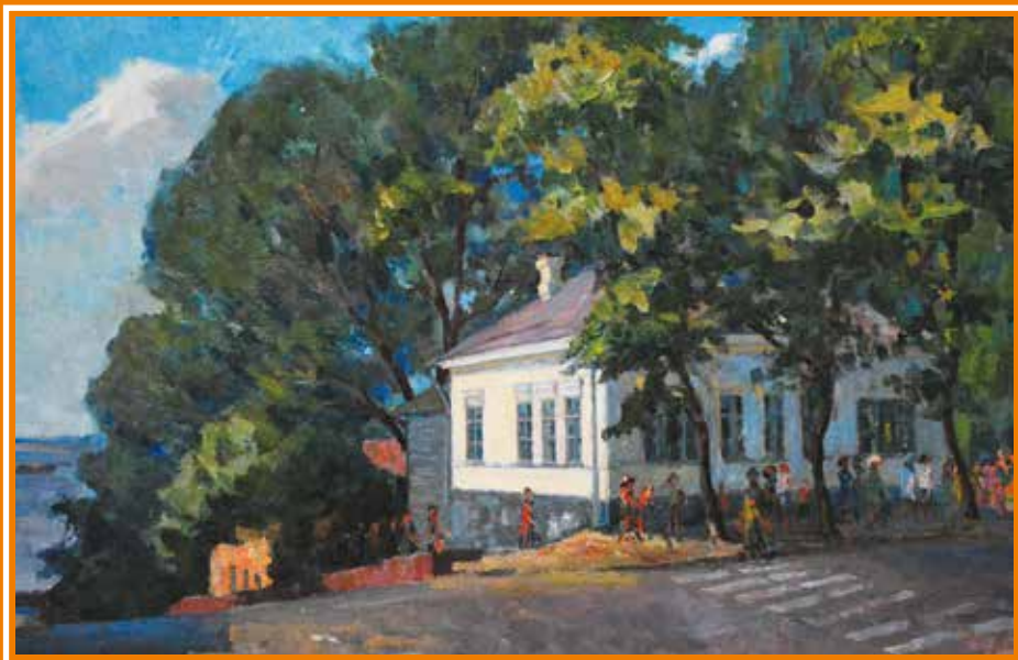
А.П. Малютин. Дом-музей Н.Г. Чернышевского, 1978