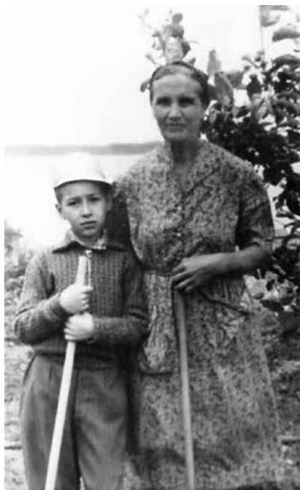
С бабушкой на даче в Пристанном. 1962 год

Самое главное впечатление, конечно же, Волга! Наряду с пассажирскими судами послевоенной постройки (они сходили с верфей в ГДР, Венгрии, Чехословакии) плавало едва ли не большее число старых пароходов. Из новых судов только флагман волжского пароходства – дизель-электроход «Ленин» и однотипный «Советский Союз» были советского производства. У скорых на трубе была широкая голубая полоса, у почтово-пассажирских рисовались две тонкие голубые, у товарно-пассажирских (но на них были и каюты) – широкая красная. Среди старых пароходов колёсные преобладали. У меня и сейчас в глазах стоит всё ускоряющееся вращение здоровенных колёс отходящего от дебаркадера судна, слышится шлёпание колёсных лопаток по воде. Длинные и широкие в центральной части буксиры тянули за собой баржи. Более новых моделей, толкающих их сзади (называли их в просторечии «толкачи»), было ещё мало.