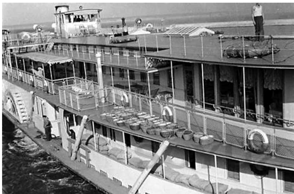
Колёсный товарно-пассажирский пароход