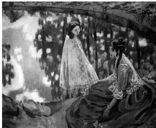
В. Э. Борисов-Мусатов. «Водоём»

В облике мусатовских героинь почти всегда сквозит что-то элегическое, на них часто лежит печать меланхолии. Глубокая задумчивость, тень усталости и озабоченности на лице, истома поникшей головы, бессильно упавшие руки – эта грусть-печаль, статичность, анемия особенно ощутимы на фоне цветущей природы, подаваемой с ярко декоративной красочностью («Водоём», 1902 год).