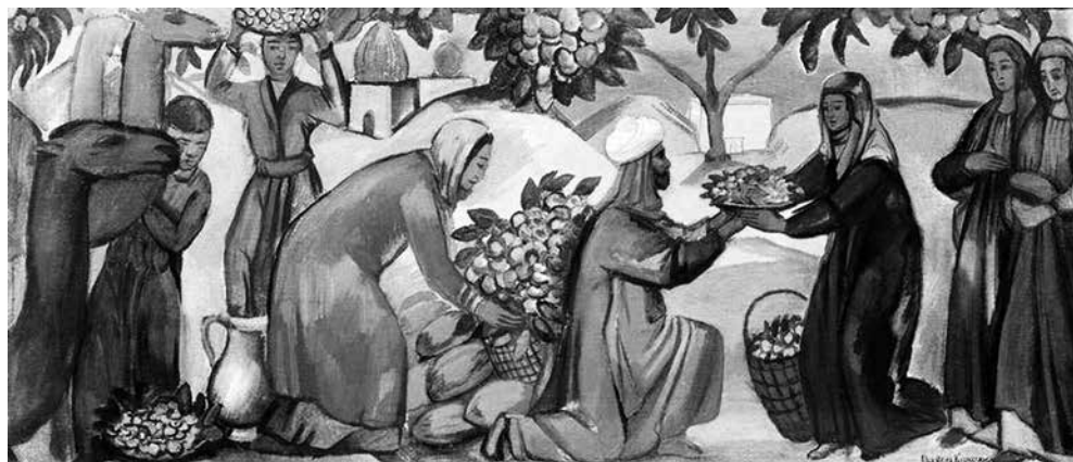
П.В. Кузнецов. «Сбор плодов. Азиатский базар»

Воссоздаваемые в этой манере жанрово-пейзажные сюжеты художник черпал в жизни Востока, который простирался для него от Крыма («Весна в Крыму», «Дорога в Алупку») через Кавказ и Среднюю Азию («Натюрморт с сюзана», «Бухарский натюрморт», «Женщина в Бухаре», «Сбор плодов. Азиатский базар») и до дальневосточных земель («В храме буддистов», «Натюрморт с японской