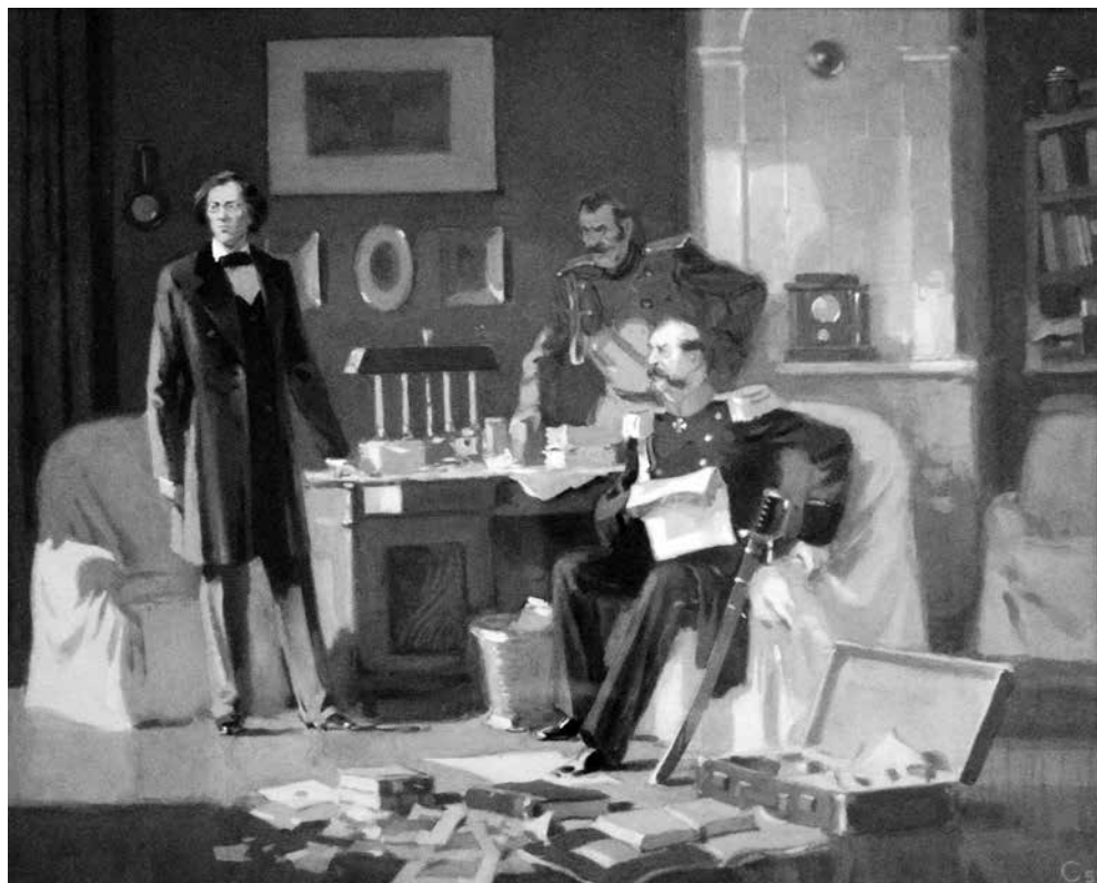
В. Н. Сигорский «Арест Н. Г. Чернышевского в Петербурге» (1950-е гг.)

7 июля 1862 года состоялся обыск на квартире у Николая Гавриловича, произведённый полковником Ракеевым. Книги, которых было очень много (несколько тысяч), были опечатаны в кабинете, бумаги и недозволенные книги отправлены в 3-е отделение. Обыск начался в два часа дня, а 7 июля 1862 года в пять часов дня Н. Г. Чернышевский был заключён в Алексеевский равелин Петропавловской крепости.