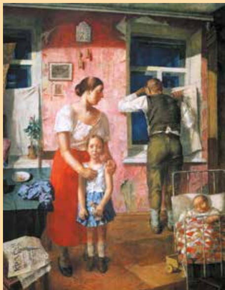
К.С. Петров-Водкин. «1919 год. Тревога»