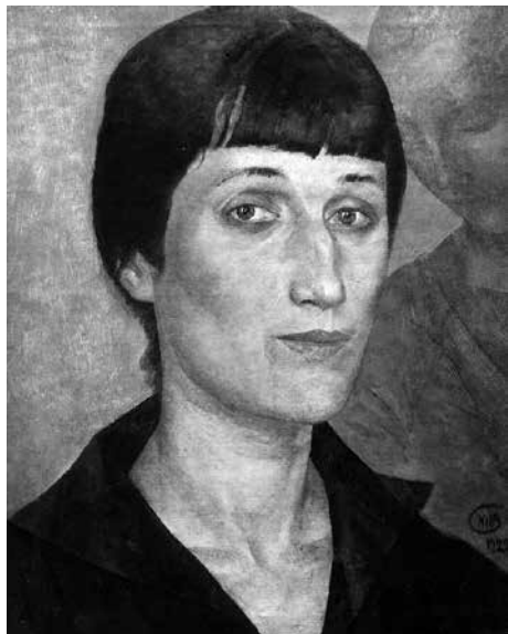
К.С. Петров-Водкин. «Анна Ахматова»

Передавая облик человека этого времени и царящее вокруг него, художник преимущественно использовал два цвета. Тёмно-коричневый на лицах получал настораживающе-землистый оттенок. Синий цвет предстал в оттенках от голубоватого с ультрамарином до бледно-синего с фиолетовым отливом. И если от первого веяло холодом тревог и отчуждённости, то второй был знаком смерти, которая неустанно подстерегала людей, с вожделием накладывая на них печать мертвенной синевы.