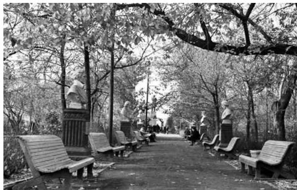
Аллея писателей. Фото 70-х годов

«Аллея писателей» (хотя в ней были бюсты и композиторов) в Липках, как её называли многие, не пережила вандализма начала 90-х годов.