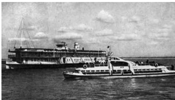
Винтовой пароход и речной трамвай «Москвич». Фото 50-х годов

В выходные уже у пристаней начиналось светопреставление. Людей пускали «порциями», а путь на посадку проходил по периметру дебаркадера – как ещё называли пристани. Отец часто брал меня на плечи – задавить в пружей толпе могли запросто.