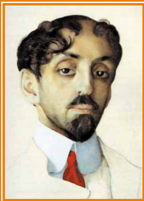
М. А. Кузмин. Портрет работы К. Сомова