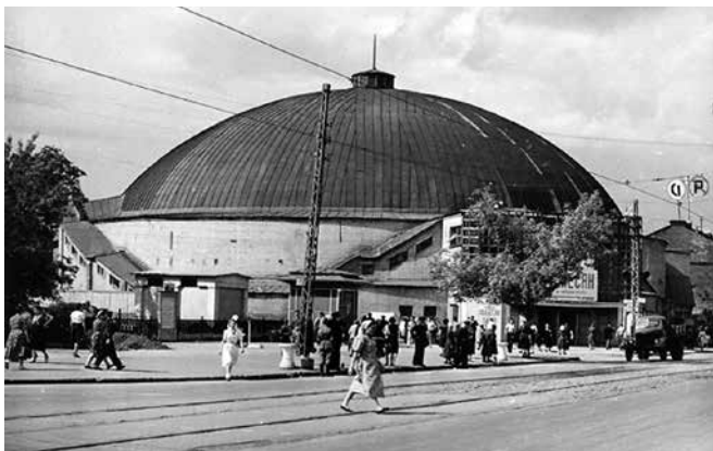
Цирк до реконструкции. Фото конца 50-х годов

Работали и другие, довольно плохонькие кинотеатры. Крохотный «Красный Октябрь» на углу Чапаева и Ульяновской чаще звали «курятником». Под стать ему был кино-