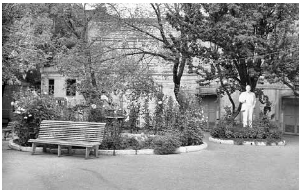
Двор перед кинотеатром «Летний». Фото 60-х годов

В грязь горожане надевали на ботинки галоши, зимой – поверх валенок, которые носило большинство. Это было удобно: никто и не думал предлагать гостям тапочки. Главным женским головным убором был платок. Мужчины зимой носили преимущественно шапки-ушанки, а в тёплую погоду нередко – соломенные шляпы. Кепки носили все. Папа, как бывало в то время, переодевался иногда вечером в пижаму. В пижамах же порой и спали, хотя эта традиция уже уходила. Я же, как и мои сверстники, носил сатиновые шаровары с бумажной рубашкой в холодное время, а с безрукавкой – летом. То, что сейчас называют «поло» и «рубашкой с коротким рукавом», в те годы, по крайней мере в Саратове, часто именовали одним словом – «шведкой». А маленькие мальчики носили на поясе лифчики, к кото-