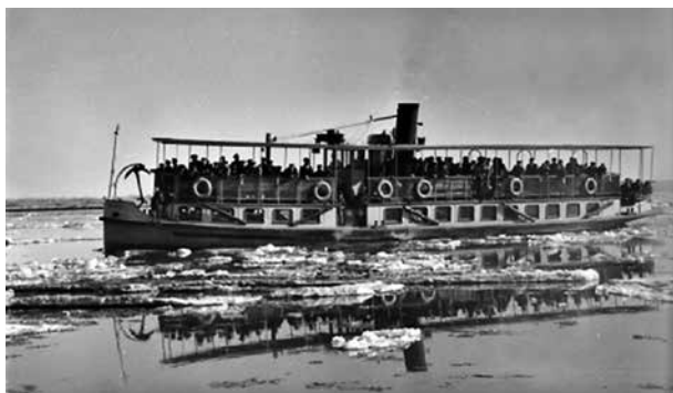
Пароход «Энгельс». Фото 60-х годов