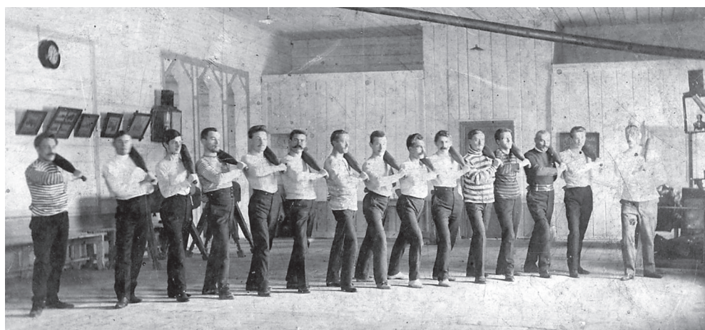
Занятия гимнастического кружка при Саратовском речном яхт-клубе. 1909–1910 гг. Саратовский областной музей краеведения