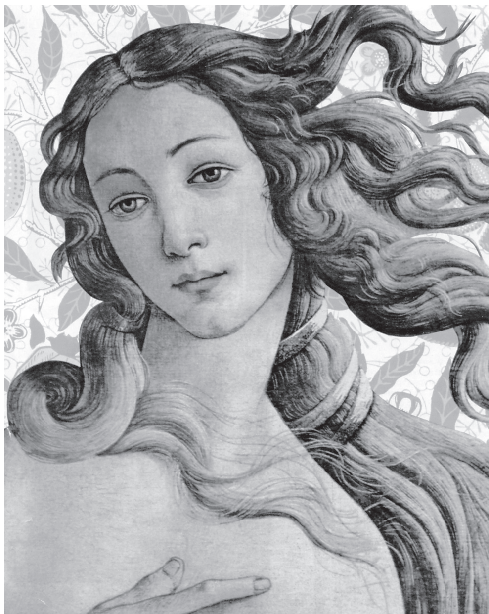
Фрагмент картины Сандро Боттичелли «Рождение Венеры» (1482–1486)