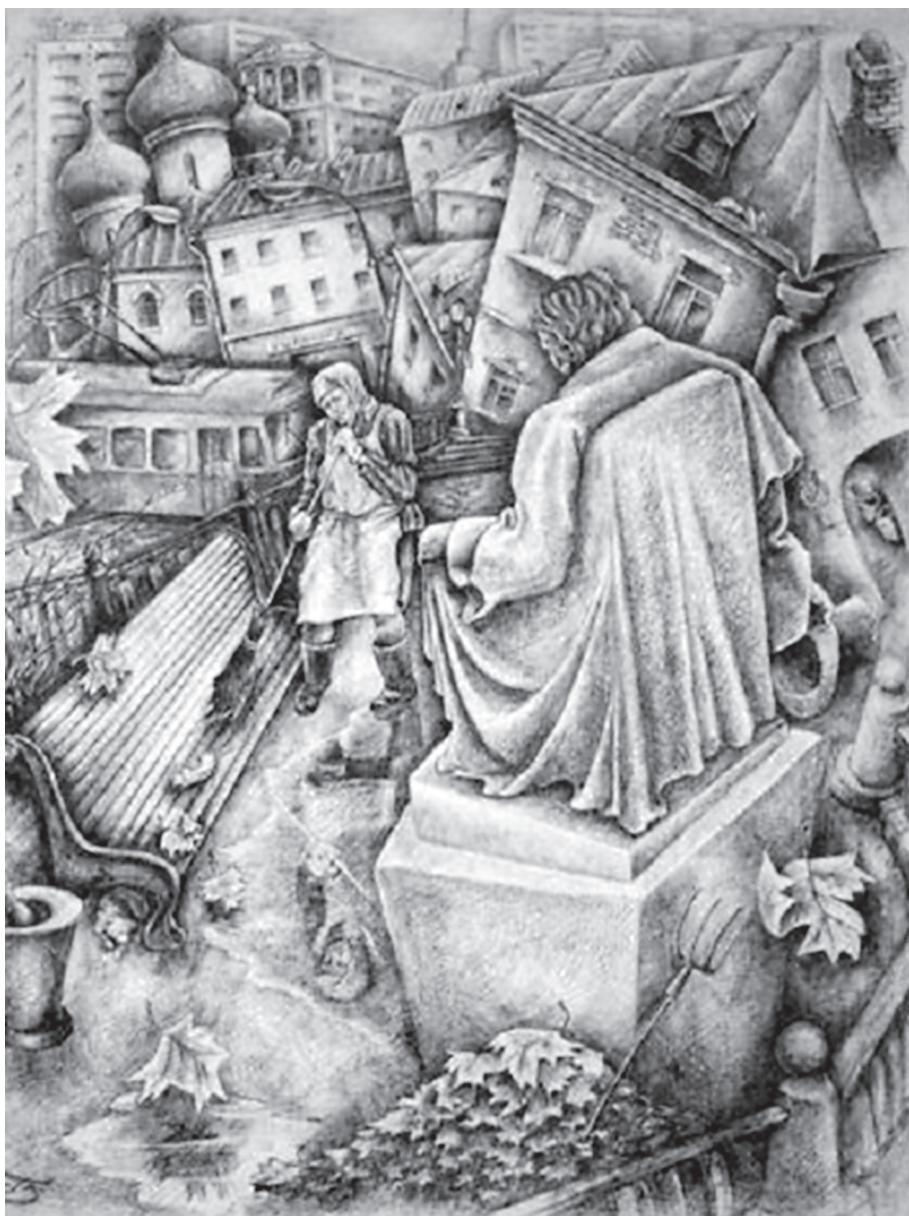
Сергей Черенцов. «Город»